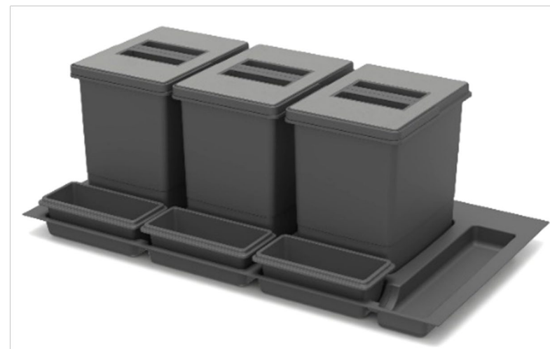
Practiko 90 version en acier