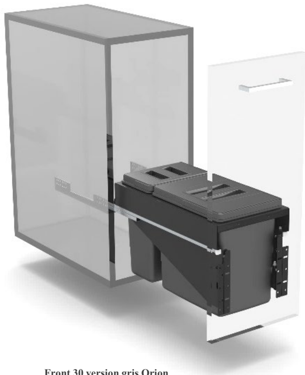
Front 30 version gris Orion