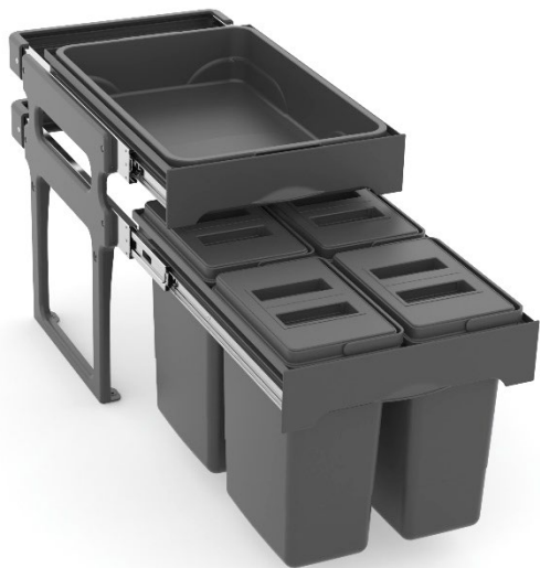
Tank 40 version gris Orion