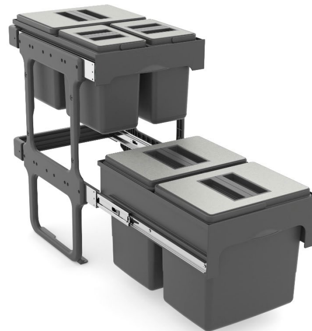
Tandem short 40 version en acier