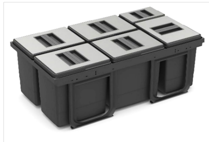
Jazz 90 version en acier