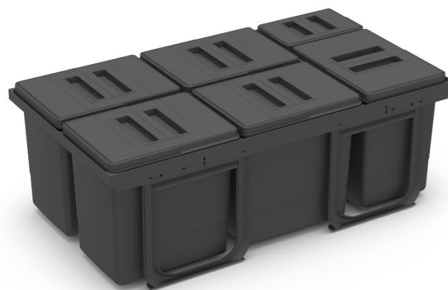
Jazz 90 version gris Orion