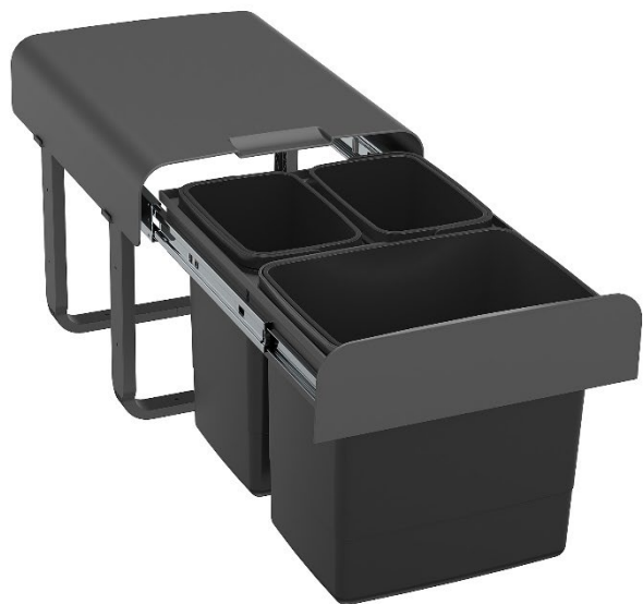
Ekko version gris Orion